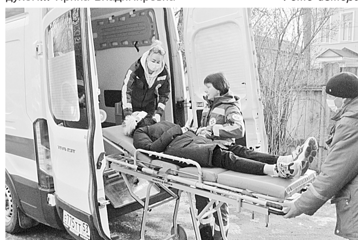
Первая бригада в действии